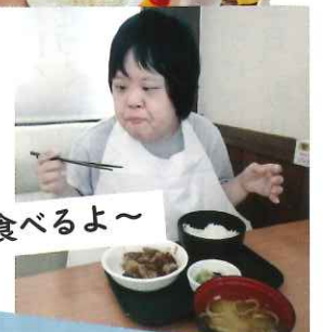
いっぱい食べるよ～