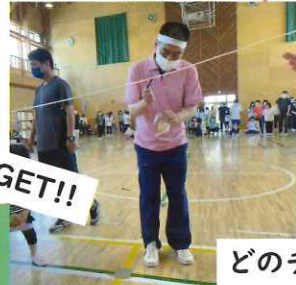
どのチームが勝つか?!