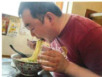
やっぱりラーメンでしょ☆