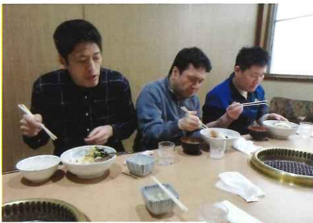
いただきますぁー♡