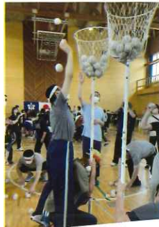
どんどん入れるよ～